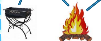
Место использования открытого огня